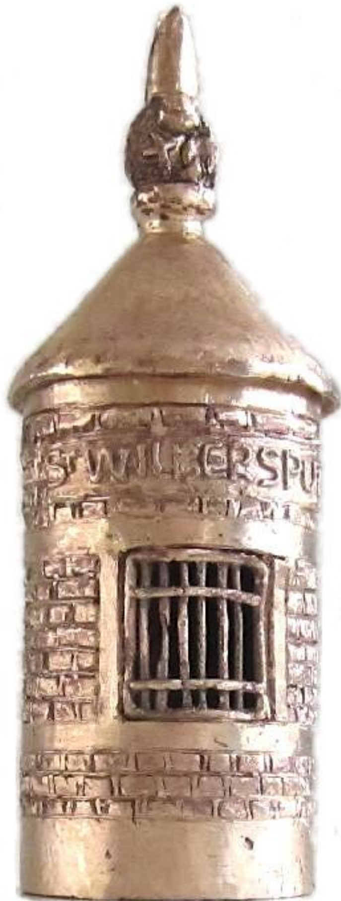
Het hekwerk van de Wilbersput is hersteld en nog meer geschuurd. Het bronzen model weegt 1307 gram, heeft een hoogte van 23 cm, een doorsnede van 7,5 cm en de dikte van het brons is ongeveer 4 mm.