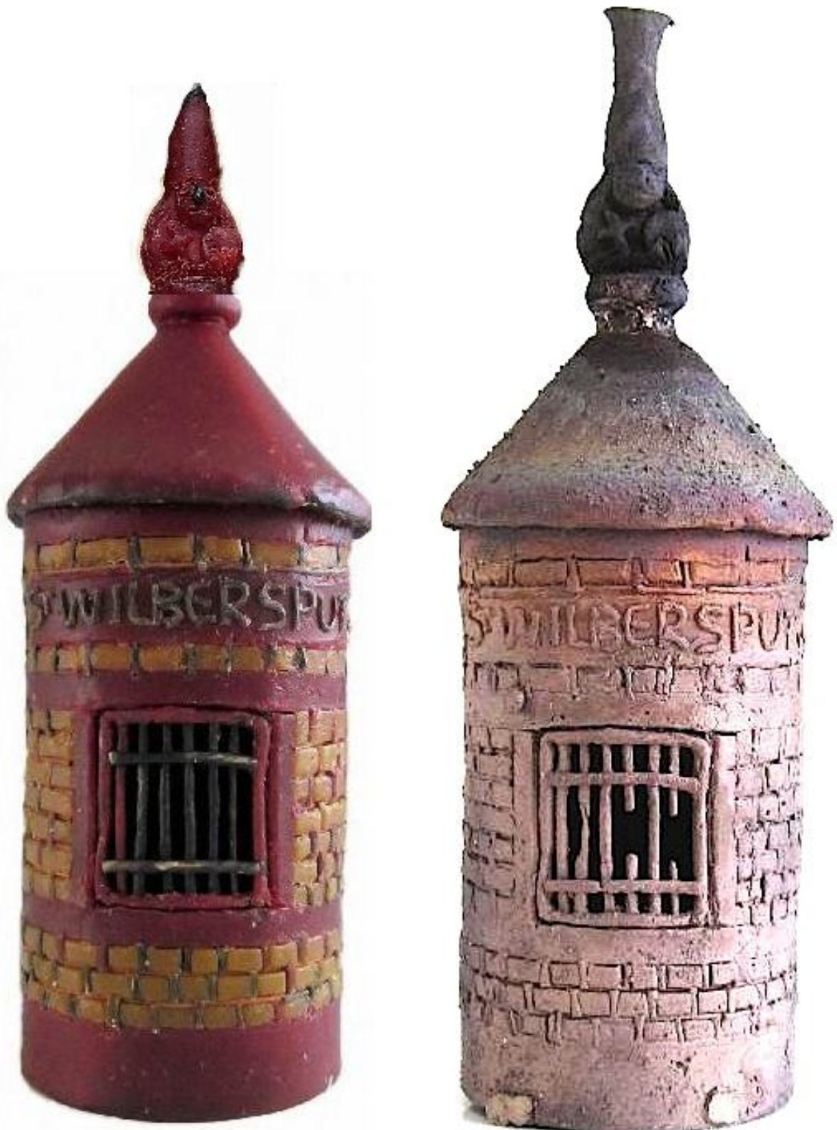
Na het gieten is de bronzen Wilbersput uitgepakt en gezandstraald.