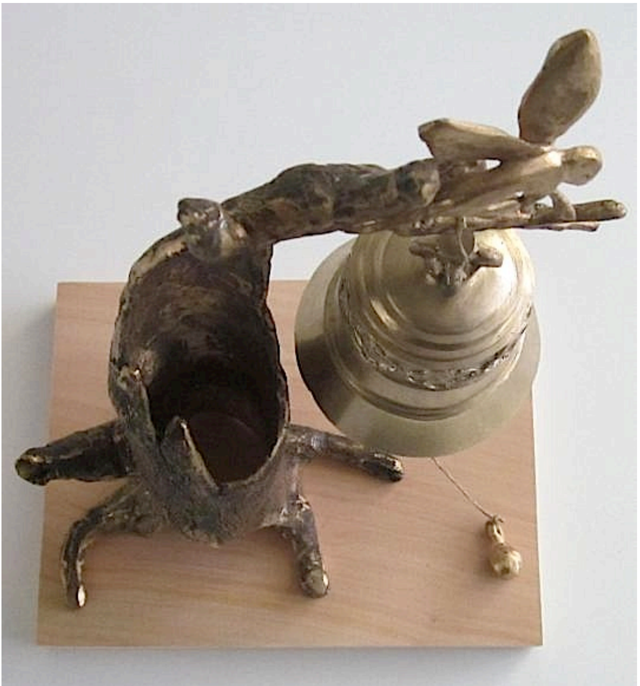
De klok van het 'Laatste Oordeel' van Jeroen Bosch