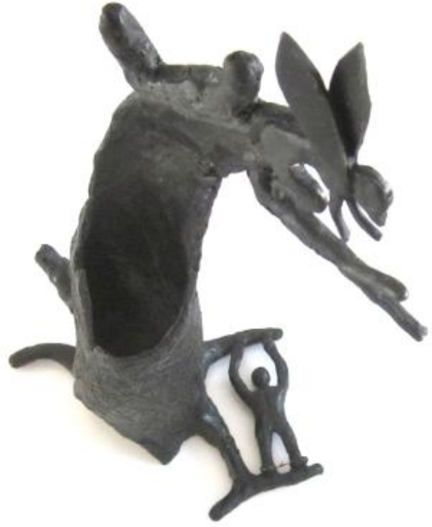
Wasmodellen van de boom, het klokje en de klepel.