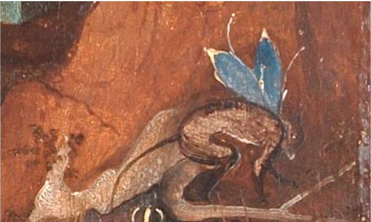
Bovenin de boom zit een sprookjesachtig figuur met blauwe vleugels.