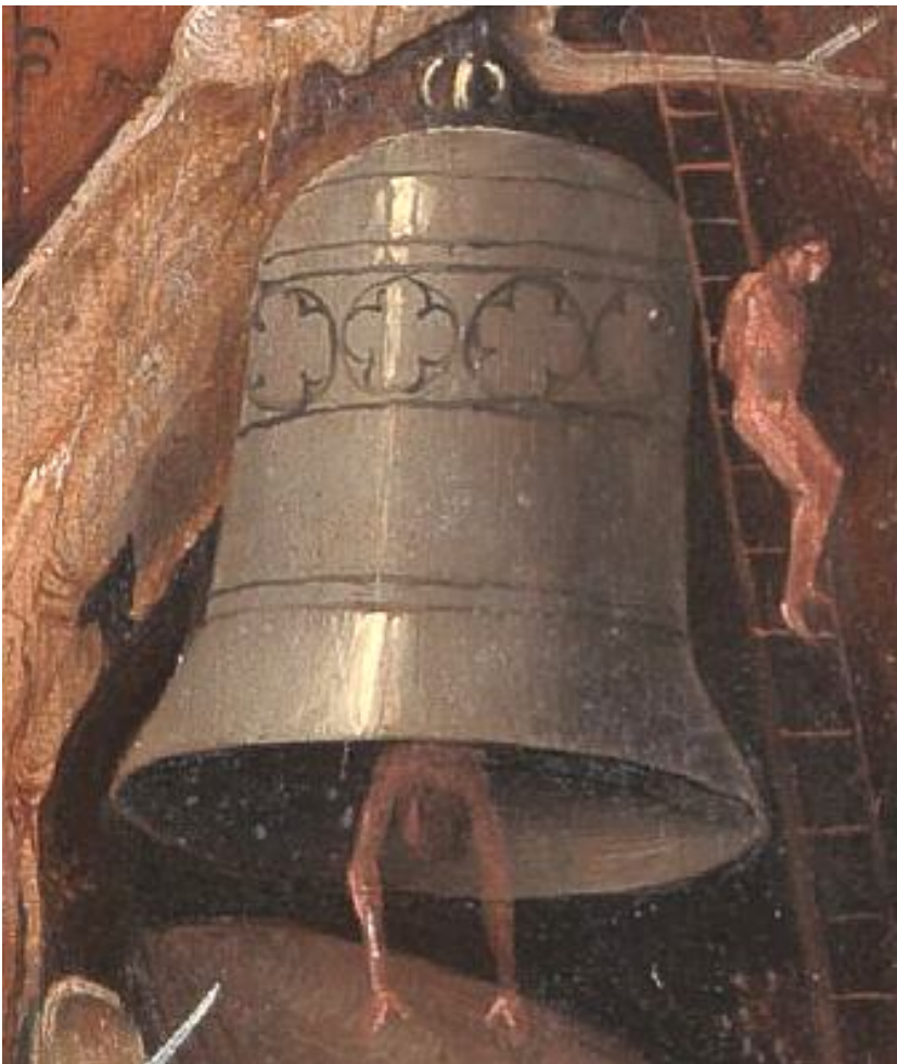
In de Middeleeuwen werden klokken gegoten in de vorm van een bijenkorf.