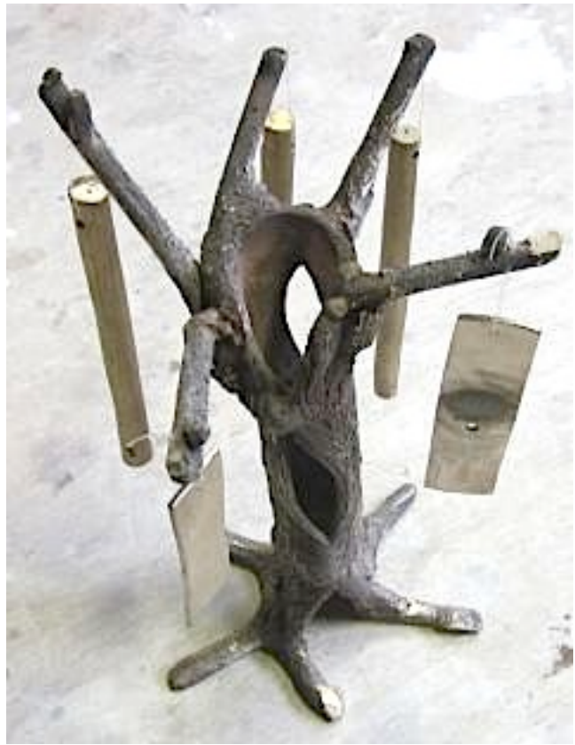
De geschuurde klankstaafjes met 2 klankplaatjes in de bronzen wilg.