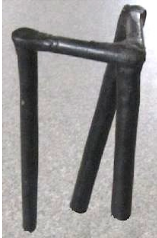
Het wasmodel van drie klankstaafjes