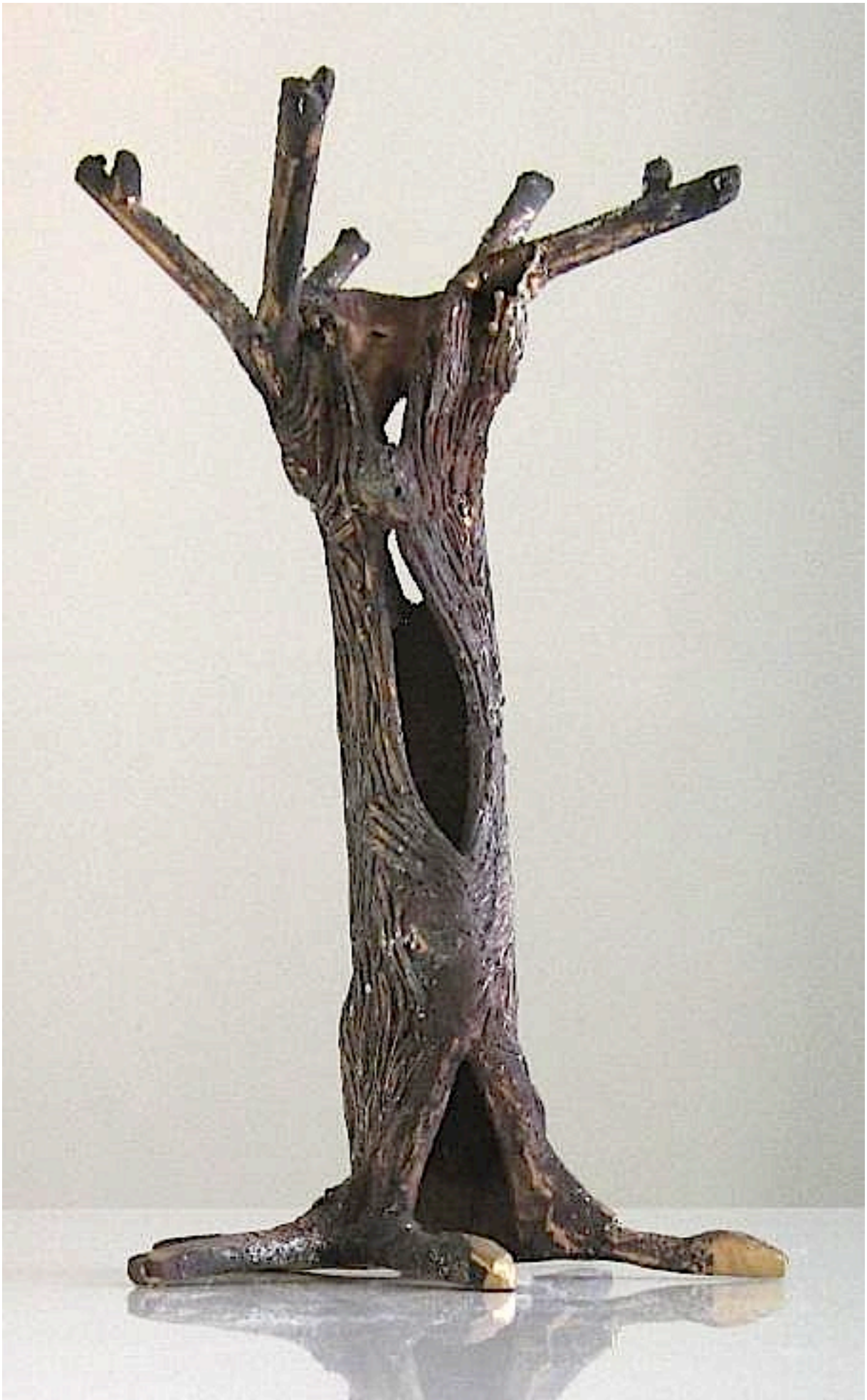
De bronzen wilg is geschuurd. Hoogte is 26 cm en breedte van voet en kroon is 15 cm. De doorsnede van de holle wilg is 4 cm en de bronzen wilg weegt 1330 gram