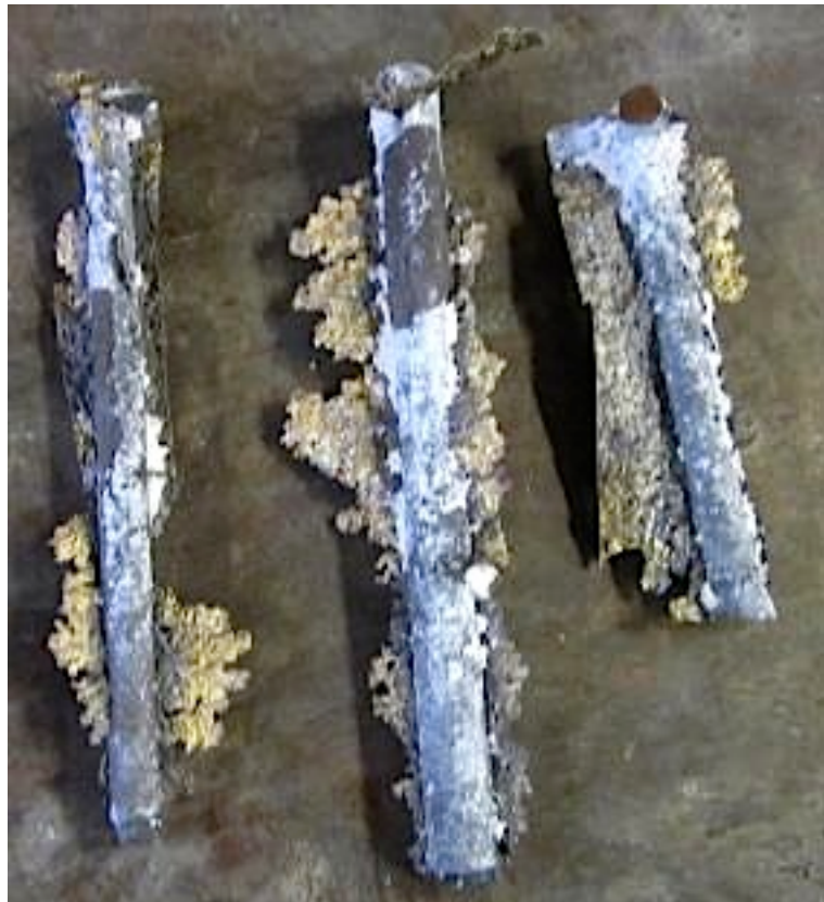
De klankstaafjes kwamen met vrij veel uitstulpingen uit het gietproces.