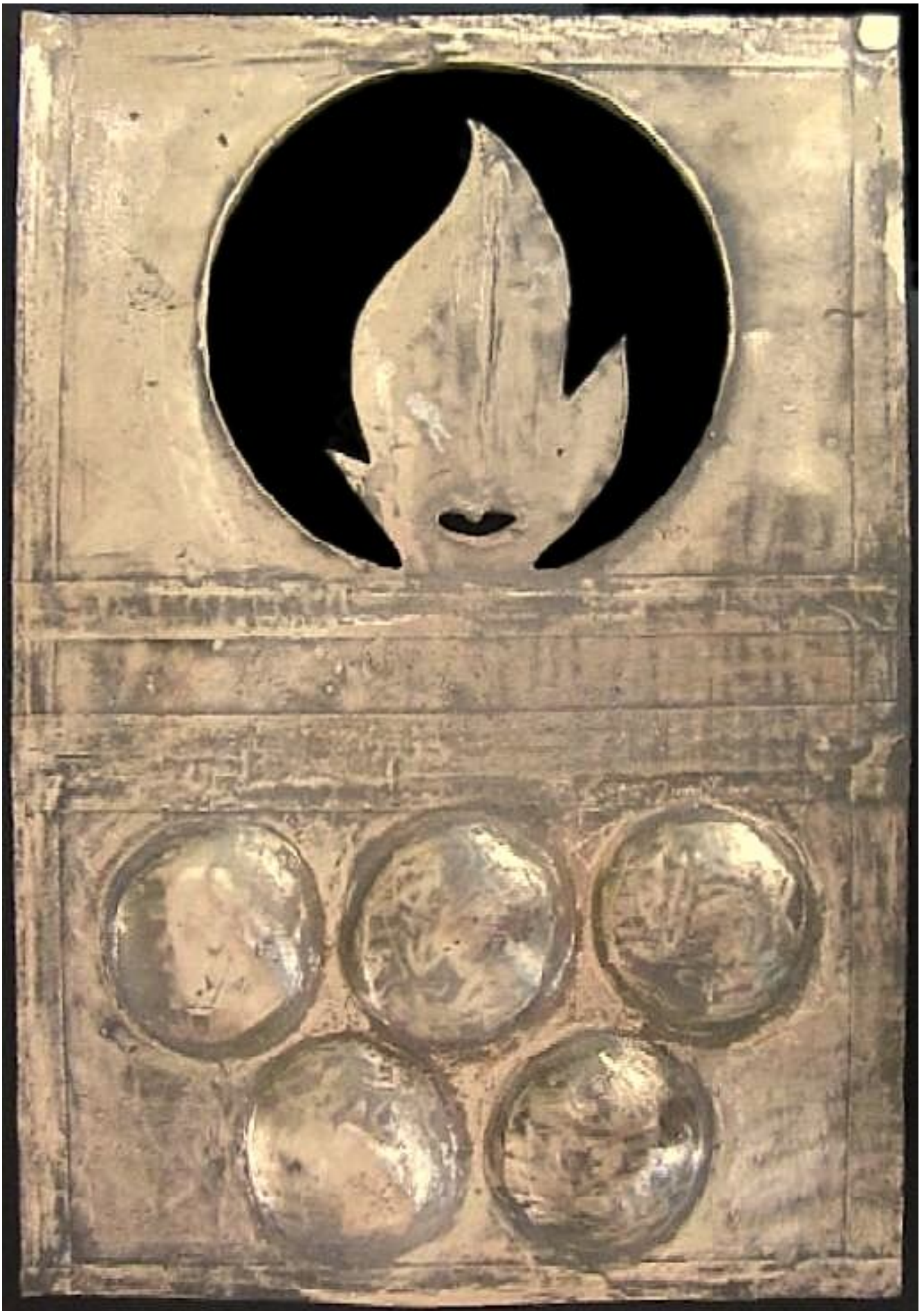
De 5 cirkels zijn uitstekende bolletjes geworden. Die elk een eigen klank hebben.