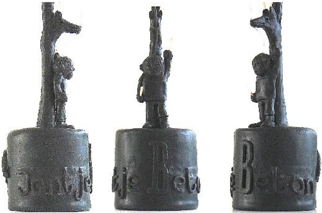
Wasmodel van het Prinsesseklokje met de tekst: Jantje Beton.

De klokjes zijn gegoten met klokkenbrons dat is samengesteld uit 80% koper en 20% tin. De 'onderzetters' zijn gegoten met RG5 brons ofwel 95% koper en 5% brons. Klokkenbrons klinkt helder en draagt verder dan gewoon brons. Er moet nog veel worden geschuurd.