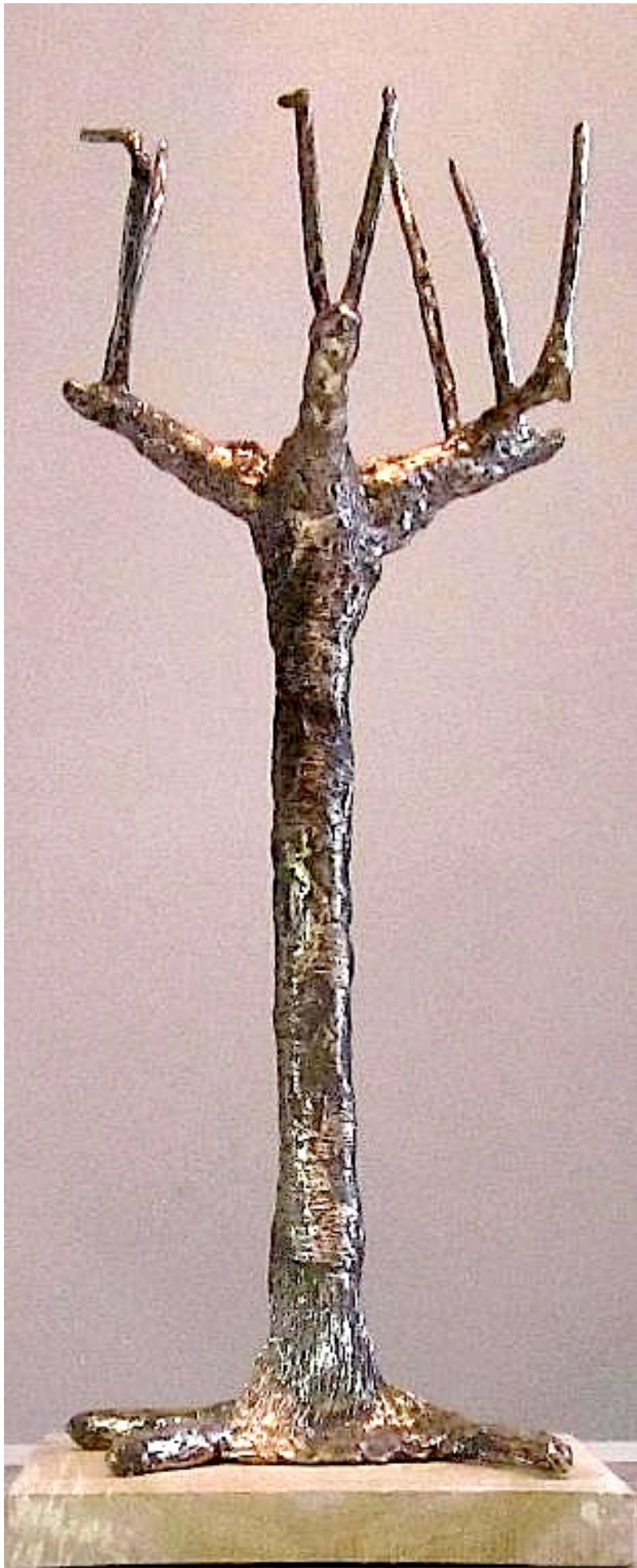
De Knotberk van Vincent van Gogh is gegoten met RG7 brons. De hoogte van de bronzen knotberk is 34 cm en weegt 1103 gram