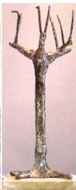
Knotberken van Vincent van Gogh (1853 - 1890), Nuenen, maart 1884. De knotberk in het midden van de tekening werd voor mijn een inspiratiebron voor het driedimensionaal in brons gieten ervan. De knotberk is gegoten met RG7 brons, weegt 1138 gr. en heeft een hoogte van 35 cm.