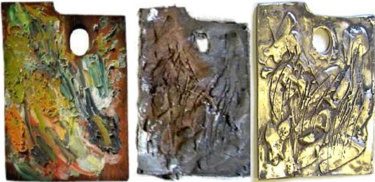
Het schilderspalet van Vincent van Gogh is met klokkenbrons gegoten en weegt 119 gr. De grootte van het bronzen palet is 8,5 x 6 cm.