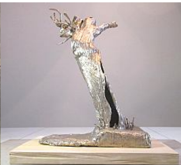
Vincent Willem van Gogh (1853-1890). Knotwilg in Den Haag , 1882. (Coll. Van Gogh Museum, Amsterdam). Van december 1881 tot september 1883 verblijft Vincent van Gogh in Den Haag en Scheveningen. De boom is gegoten met RG7 brons, weegt 2535 gram en heeft een hoogte van 25 cm.