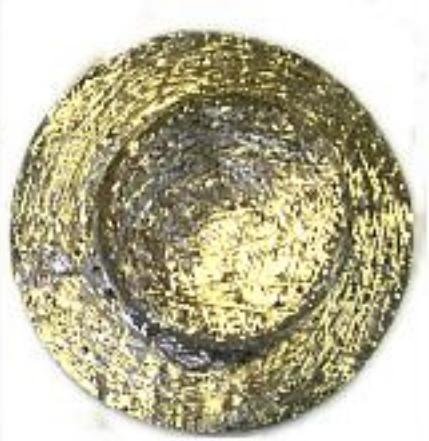
De hoed van stro is met klokkenbrons gegoten en weegt 182 gr. De doorsnede van de bronzen hoed is 8 cm.